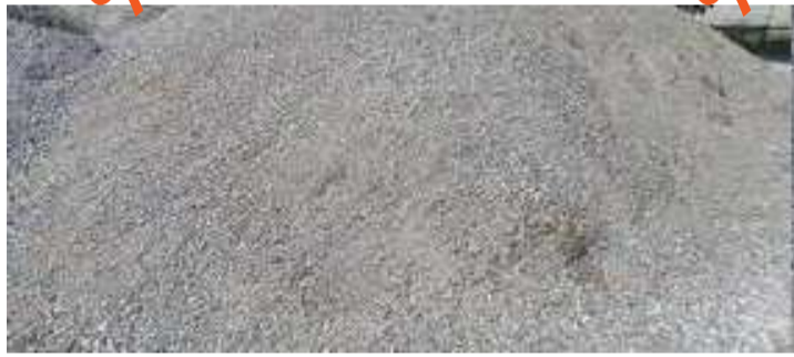
पथक गेवराई हे अवैध वाळू उत्खनन व वाहतूक बाबत गास्त घालत असताना एक

गेवराई तालुक्यातील तलवाडा पोलिस स्टेशनच्या हद्दीत सातत्याने अवैधरित्या केणीव्दारे वाळू उपसा व वाहतूक सुरु आसल्याचे बोलले जात असताना हे काम गेवराई महसूलच्या आधिपत्यखाली आसल्याचे सांगत स्थानीय पोलिस मात्र विविध अवैध धंद्यांचे हासे जमवण्यातच दंग दिसून येत आसल्याची तलवाडा परिषरात चर्चा होत असतानाच गेवराई तहसीलचे महसूलचे पथक आज दिनांक १३/१/२०२४ रोजी सकाळी महसूल