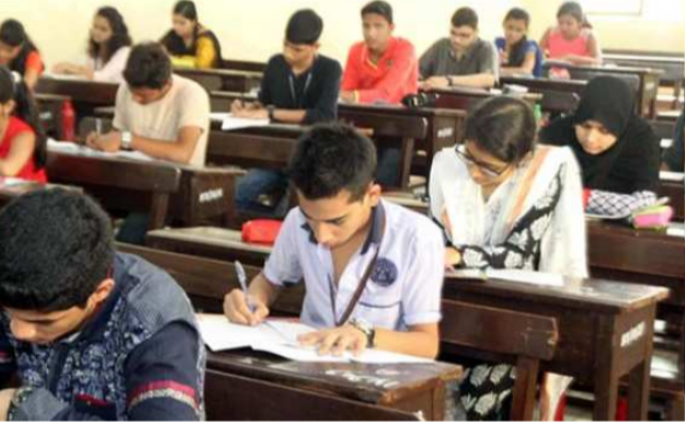
यापूर्वीच पार पडल्या आहेत. बुधवारपासून लेखी परीक्षेला सुरुवात होणार असून, लातूर जिल्हात ९५, धाराशिव ४२ आणि नांदेड जिल्हातील १०१ केंद्रावर या परीक्षा होणार आहेत. २१ फेब्रुवारी ते १९ मार्च या कालावधती परीक्षा होणार असून,

लातूर । वृत्तसेवा महाराष्ट्र राज्य माध्यमिक व उच्च माध्यमिक शिक्षण मंडळातर्फे बारावीच्या लेखी परीक्षेला २१ फेब्रुवारी, बुधवारपासून सुरुवात होणार असून, लातूर विभागीय मंडळातील ९६ हजार १७९ विद्यार्थी परीक्षेला सामोरे जाणार आहे. यासाठी २३८ केंद्रांची निवड करण्यात आली असून, बुधवारी पहिलाच पेपर इंग्रजीचा असल्याने शिक्षण मंडळाकडून कॉपीमुक्त वातावरणात परीक्षा पार पाडण्यासाठी विशेष अभियान राबविण्यात येत आहे. लातूर विभागीय मंडळात नांदेड, धाराशिव आणि लातूर या तीन जिल्हांचा समावेश असून, बारावीच्या प्रात्यक्षिक परीक्षा