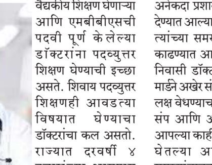
वैद्यकीय शिक्षण घेणाऱ्या आणि एमबीबीएसची पदवी पूर्ण केलेल्या डॉक्टरांना पदव्युत्तर शिक्षण घेण्याची इच्छा असते. शिवाय पदव्युत्तर शिक्षणही आवडत्या विषयात घेण्याचा डॉक्टरांचा कल असतो. राज्यात दरवर्षी ४ हजारोंच्या आसपास डॉक्टर पदव्युत्तर शिक्षण घेतात. मात्र, शिक्षण घेताना त्यांना अनेक अडचणींचा