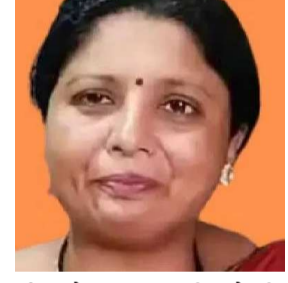
परिषद घेत सरकारवर टीका केली. त्या म्हणाल्या. भाजपाला ओबीसीची काळजी असती तर त्यांनी ओबीसी नेत्या पंकजा मुंडे यांना राज्यसभेची उमेदवारी दिली असती. मराठा आरक्षणाचा प्रश्न भाजपा सोडवू शकते मात्र, त्यांना हा प्रश्न सोडवायचा नाही. हे सरकार

नगर । प्रतिनिधी काँग्रेस-राष्ट्रवादीतून गेलेल्यांना भाजपात न्याय मिळतोय मात्र, भाजपातील निष्ठावंतांवर सतरांच्याच उचलण्याची वेळ आली आहे. घरचे उपाशी आणि नाहेरचे तुपाशी अशी सध्या भाजपातील परिस्थिती आहे. ओबीसी नेत्या पंकजा मुंडे यांना आताही राज्यसभेची उमेदवारी नाकारली गेली. त्यामुळे मुंडे यांना आता भाजपात जास्त अन्याय सहन न करता शिवसेनेत यावे, असे आवाहन शिवसेनेच्या (उबाठा) उपनेत्या सुषमा अंधारे यांनी केले. शिवसेनेच्या मुक्त संवाद यात्रेनिमित्त नगर शहरात आलेल्या अंधारे यांनी शनिवारी (दि. १७) येथे पत्रकार