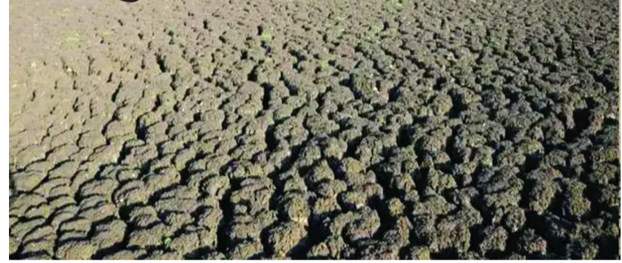
फेब्रुवारी महिन्यामध्ये बहुतांश ठिकाणी टँकरची मागणी झाली आहे. काही ठिकाणी टँकर सुरु करण्यात आले. ज्या विहिरींना आणि बोरला

बीड । प्रतिनिधी जिल्ह्यासह मराठवाड्यात पिण्याच्या पाण्याची गंभीर समस्या निर्माण होणार आहे. मार्च महिना उजडला नाही तोच उन्हाच्या झळा जाणवू लागल्या. पाऊस कमी पडल्यामुळे विहिरींनी तळ गाढला अनेकांचे बोर आटले. त्यामुळे पाण्यासाठी लोकांना वन-वन भटकती करावी लागू लागली. केज, धारूर आणि लातूर या तीन ठिकाणी पाणी पुरवठा करणार्या मंजरा धरणातही यंदा फक्त १२ टक्के पाण्याचा साठा शिल्लक राहिला. बीड न.प.ला पाणी पुरवठा होत असलेल्या माजलगावच्या धरणात तर २ टक्के पाणी शिल्लक राहिले. जिल्ह्यातील एकूण धरणात फक्त १३ टक्के पाण्याचा साठा असल्याने आगामी काळात पाण्याचा प्रश्न अतिगंभीर होणार असल्याचे दिसून येत आहे. मराठवाड्यामध्ये दुष्काळ असल्याने पाण्याची समस्या दिवसेंदिवस गंभीर होवू लागली.