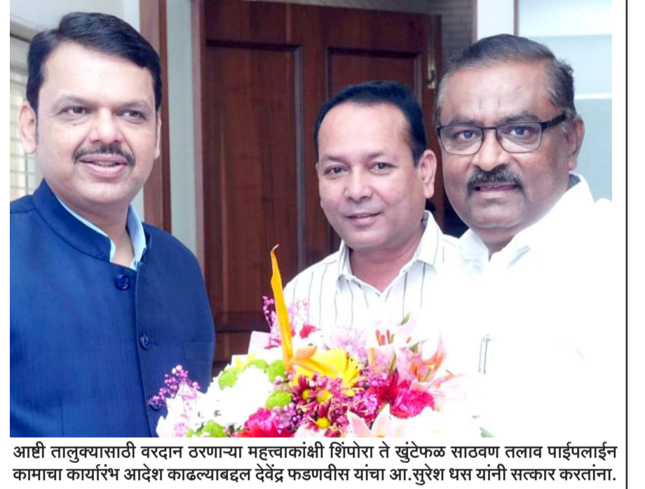
आधी तालुक्यासाठी बरदान उरणे-या महत्त्वाकांक्षी शिंपोरा ते खुंटेफळ साठवण तलाव पाईपलाईन कामाचा कार्याभंग आदेश काढल्याबद्दल देवेंद्र फडणवीस यांचा आ.सुरेश धस यांनी सत्कार करताना.

खाडेवाडी, शिंदेवाडी, चोपनवाडी या रस्त्यांसाठी मुख्यमंत्री सडक योजनेत २७ कोटी ८० लाख तर वसंतराव नाईक तांडा सुधार योजनेअंतर्गत दोन कोटी रुपयांची निधी मंजूर करण्यात आली आहे. त्याचप्रमाणे बंद पडलेल्या उपसा जलसिंचन योजना पुन्हा सुरु करण्यात आले असून त्यासाठी अडीजशे कोटी रुपयांची निधी प्राप्त झाली असल्याचेही ते म्हणाले. उपजिल्हा रुग्णालयातील डॉक्टरांच्या निवासस्थानासाठी ३० कोटी रुपये मंजूर करण्यात आले आहेत. याह पुढील पानावर