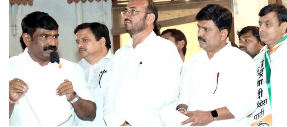
होता. आम्हाला विकास आघाडी करून न.प.निवडणूक लढवावी लागली. त्यात २२ नगरसेवक आमचे निवडून आले, पण तरीही आम्ही

बीड । प्रतिनिधी आम्ही दगड मानून दिलेल्या आणि आकार नसलेलेल्या व्यक्तीला आपण देव म्हणून निवडून दिले. जो आपल्यामुळे आमदार झाला त्यानेच तुमचा विश्वासघात केला. या सर्व गोष्टीची जबाबदारी मी स्वतः घेवून तुम्हा सर्वांची माफी मागतो असे स्पष्ट करत आपल्या सर्वांना विश्वासात घेतल्याशिवाय बीडमध्ये उमेदवार लादला जाणार नाही. बीडमधील सर्व तरुण आणि नगरपालिकेतील अनुभवी पदाधिकाऱ्यांना विश्वासात घेवून यापुढे कोणतेही निर्णय घेतले जाणार नाहीत अशी ग्वाही पालकमंत्री तथा कृषीमंत्री धनंजय मुंडे यांनी दिली. तर अजितदादा तुम्ही सर्वांनी गतवेळी विधानसभेचा उमेदवार आमच्यावर लादला. ते ५०० मतांचे सुट्ट्या मालक नव्हते. पण वीस-वीस वर्षे जे नगरपालिकेत सदस्य होते, त्यांनी केलेल्या आवाहानानुसार अनेक मते मिळाली अन् ते आमदार झाले, पण तो अपघात