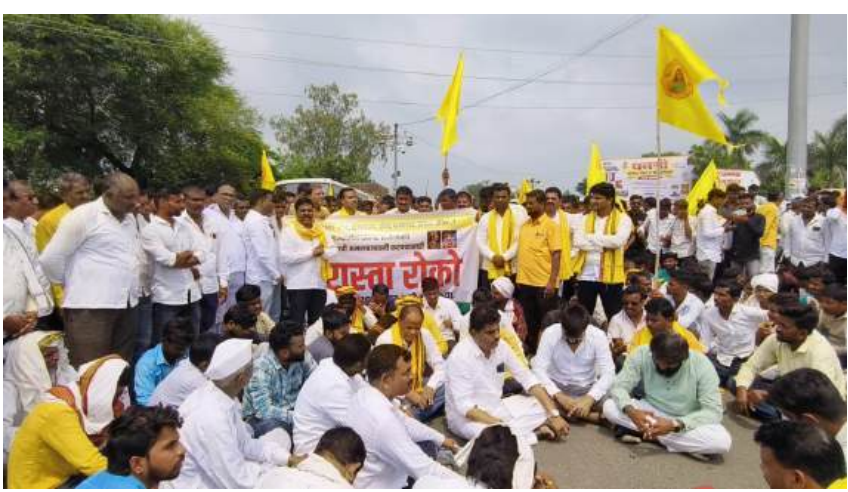
दि. १ सप्टेंबर पासून राज्यव्यापी आमरण उपोषण सुरू आहेत या आंदोलनास पाठिंबा म्हणून दि. २३ सप्टेंबर रोजी संबध महाराष्ट्रात रस्ता रोको आंदोलन करण्याचे हाक समाजाच्या वतीने देण्यात आली होती म्हणून त्या हाकेला ओ म्हणून माजलगाव तालुक्यातील सकल धनगर

माजलगाव । प्रतिनिधी गेल्या अनेक वर्षांपासून धनगर समाजाची एसटी आरक्षणाची मागणी राज्यकर्त्यांच्या उदासीन धोरणामुळे प्रलंबित आहे या जिव्हाळ्याच्या मागणीसाठी माजलगाव तालुक्यातील सकल धनगर समाजाच्या वतीने परभणी फाटा येथे दिनांक २३ सप्टेंबर रोजी तब्बल दोन तास रस्ता रोको आंदोलन करण्यात आले या रोडवरील वाहतूक सुरळीत करण्यासाठी पोलीस प्रशासनाला तब्बल दोन लागले . धनगर जमातीस एसटी आरक्षणाची अंमलबजावणी करावी या जिव्हाळ्याच्या मागणीसाठी पंढरपुर ,लातूर,येथे