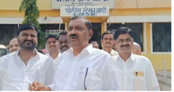
मासे विक्री व्यवसायातून अधिक पैसे गुंतवण्याचे आमिष दाखवण्यात नफा मिळवण्यासाठी ऑनलाईन आले.. त्यामध्ये तालुक्यातील

आष्टी । प्रतिनिधी एएससी या कंपनीने ऑनलाईन व्यवसाय द्वारा मासे विक्री आणि इतर प्रकारचे व्यवसाय अधिक पैसे मिळवण्याचे आमिष दाखवून गोरगरीब, छोटे-छोटे व्यवसायिकांना लुटले असून या व्यवसायिकांचे पैसे परत मिळवून देण्यासाठी बीड जिल्हा सायबर क्राईम सेलचे अधिकाऱ्यांनी अधिक कार्यक्षमतेने आणि कठोरपणे कारवाई करण्याची आवश्यकता आहे..अशी जनतेची अपेक्षा असून.