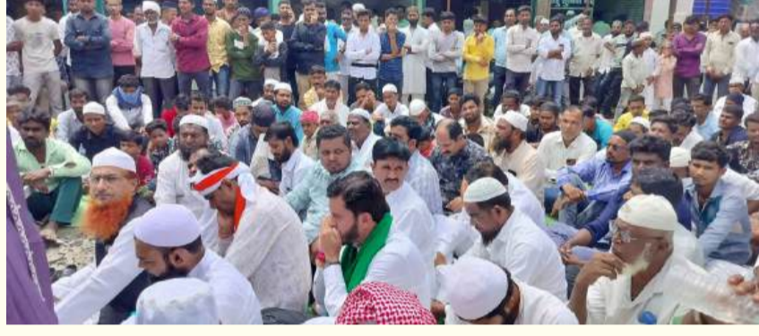
▶ सात दिवसांत अतिक्रमण उठणार

तीन दिवसात धारकांनी अतिक्रमण काढावे नाहीतर प्रशासन सात दिवसात अतिक्रमण काढील व खर्च वसूल करील असे नोटीसा तलाठी सजावकरून तात्काळ देण्यात आल्या .