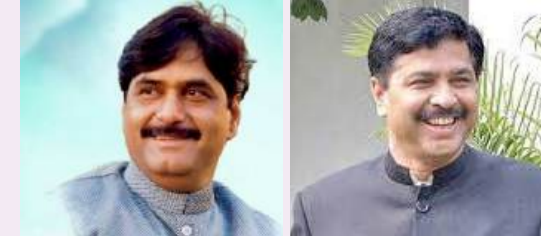
संस्थेस लोकनेते स्व.गोपीनाथराव मुंडे यांचे तर अंबाजोगाई

महाराष्ट्र शासनाच्या कौशल्य व उद्योजकता विभागाने घोषित केलेल्या निर्णयप्रमाणे बीड जिल्ह्यातील शासकीय औद्योगिक प्रशिक्षण संस्थांना मान्यवरांची नावे देण्यात येत असून, बीड जिल्ह्यातील परळी येथील शासकीय औद्योगिक प्रशिक्षण