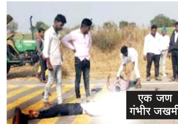
एक जण गंभीर जखमी