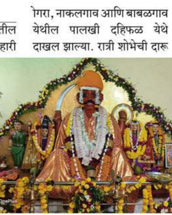
उडवण्यात आली. दि.७ शनिवारी चंपापल्लीच्या पहाटे सुर्योदयापूर्वी खंडोबा देवाचे म्हाळसा देवी सोबत लग्न लावण्याचा कार्यक्रम संपन्न झाला. हजारो भाविक भक्तांनी देवाच्या लग्नास उपस्थित राहून दर्शन घेतले. यात्रेनिमित्त सोमवारी कुस्त्यांची जंगी दंगलीचा कार्यक्रम होणार असल्याची माहिती श्री खंडोबा देवस्थान कमिटी कडून देण्यात आली. कुस्तीच्या दंगलीतील कुस्ती स्पर्धे मध्ये १०

दिंद्रुड । प्रतिनिधी घारूर तालुक्यातील श्रीक्षेत्र देवदहिफळ येथे मल्हारी म्हाळसाकांत खंडेरायाची मोठी यात्रा भरते. याच पार्श्वभूमीवर शनिवारी पहाटे सुर्योदयापूर्वी खंडेरायाच्या लग्नाचा पारंपारिक सोहळा पार पडला. सोहळ्या विवाह सोहळ्यास हजारो भाविक भक्तांनी उपस्थिती लावली. यात्रेत सोमवारी कुस्त्यांची जंगी दंगल रंगणार असून पहिलवान व कुस्ती शौकीन भंडळींनी याचा लाभ घेण्याचे आवाहन यात्रा उत्सव समितीच्या वतीने करण्यात आले आहे.