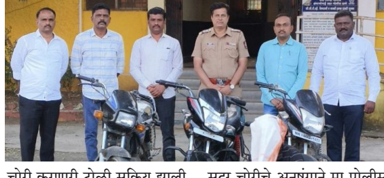
चोरी करणारी टोळी सक्रिय झाली होती दरम्यान दोन गुन्हेयांची नोंद पो.स्टे. अंबाजोगाई शहर ठाण्याम ध्ये नोंदविण्यात आली होती.

बीड । प्रतिनिधी बीड जिल्ह्यातील मागील काही दिवसापासून पाथी जाणाऱ्या लोकांचे मोबाईल हिंसकावून पळवून जाण्याचा घटनात वाढ झाली होती. अनेकांचे मोबाईल असेच पसार झालं होते परंतु काही नागरिकांनी तक्रार दिल्या नसल्याने मोबाईल चोरांचे प्रमाण वाढले होते. अंबाजोगाई शहरात मोटार सायकल वर येवून पाई जात असलेल्या व्यक्तीचे मोबाईल हिंसकावून नेवून