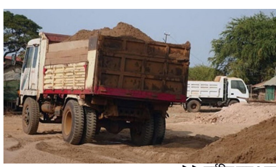
पाठलाग करून ती वाहने