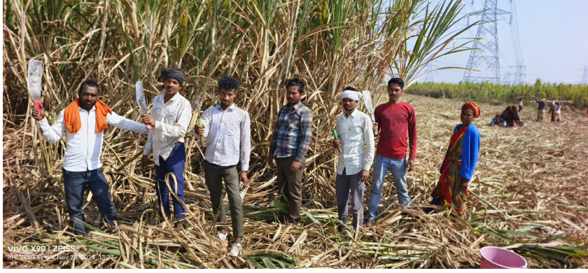
बीड जिल्हा ऊसतोड मजुरांचा

जिल्हा आहे . सर्वता ही बीड जिल्ह्याला लागलेली कीड आहे. बीड जिल्हा म्हटलं महाराष्ट्र असो की कर्नाटक समोरच्यांना विचारलं की आपला कुठला जिल्हा, तर आपण म्हणलो ना बीड, तर नकळत समोरच्या गालावर हसू येत. आणि कर्नाटक मध्ये त्याला गाबाळे जिल्हा असे म्हणतात. कारण ऊसतोड मजूर हे आपलं बिन्हाड पाठीवर बांधून आपल्या पोटाची कोळी भरण्यासाठी, त्यांच्या राज्यात किंवा मग आपल्याच राज्यात पश्चिम महाराष्ट्रात. चार