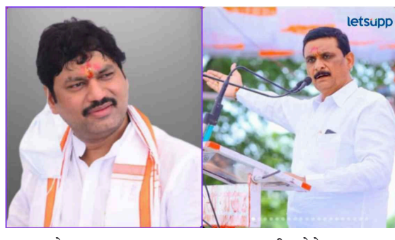
आमदाराने खळबळजनक गौप्यस्फोट केले आहेत. आष्टी पाटोदा शिरूर या म तदारसंघात महायुतीमध्ये मैत्रीपूर्ण

आष्टी । प्रतिनिधी महाराष्ट्र विधानसभेच्या निवडणुका नुकत्याचं पार पडल्या. सध्या सत्ता स्थापनेच्या हालचाली सुरू आहेत. २३ नोव्हेंबर रोजी निकाल लागला असला तरी अद्याप मुख्यमंत्रीपदाबद्दल अधिकृत अशी घोषणा महायुतीकडून झालेली नाही. त्यामुळे मुख्यमंत्री पदासह बाकी अनेक घडामोडींबद्दल उलट-सुलट चर्चा सुरू आहेत. अशा वातावरणातच महायुतीम धील घटकपक्ष असलेल्या राष्ट्रवादी अजित पवार गटाच्या मावळत्या