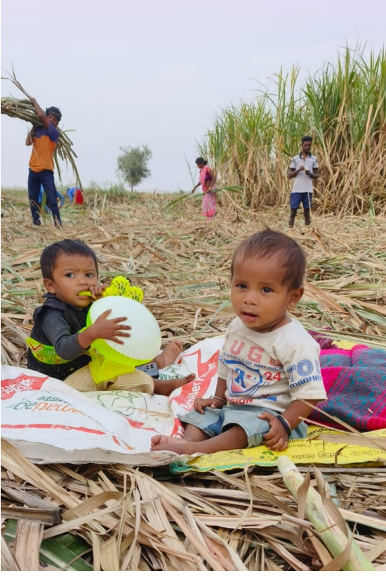
वडवणी । प्रतिनिधी

ऊसतोड मजुरांच्या मुला मुलींचं स्थलांतर कधी थांबणार ? ; मजुरांच्या मुला मुलींचे ४ महिने शैक्षणिक नुकसान