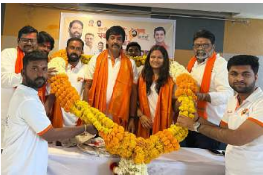
दौरा पार पडतो आहे. या दौऱ्यात आढावा बैठका देखील घेण्यात ठिकठिकाणी पदाधिकाऱ्यांच्या येत >>> उर्वरित पान २ वर