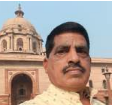
नवी दिल्ली । प्रतिनिधी

महाराष्ट्रातील दोन्ही सरकार मधील माजी ३ ही कृषी मंत्र्यांनी पिक विमा कंपनीच्या माध्यमातून टक्केवारी घेतल्यामुळे पिक विमा कंपनी नियमानुसार शेतकऱ्याला