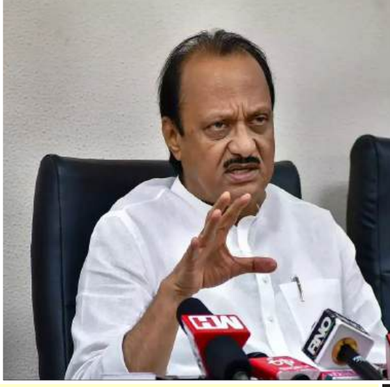
पुणे । प्रतिनिधी