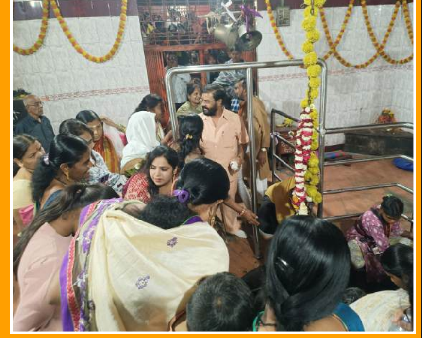
शिवालय गजबजली बुधवारी महाशिवरात्री निमित्त बीड सह जिल्ह्यातील महादेवाच्या मंदिरात मध्ये हजारां भाविकांनी दर्शनासाठी मोठ्या प्रमाणात गर्दी केली होती.