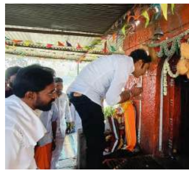
बीड । प्रतिनिधी

महाशिवरात्री निमित्त बीड म तदारसंघात आयोजित केलेल्या विविध धार्मिक व आध्यात्मिक कार्यक्रमांना