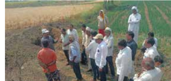
विविध योजनांचे लाभ मिळावेत यासाठी ते कृषी विभाग , पंचायत