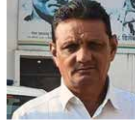
उत्कृष्ट सेवा बजावलेली आहे. सर्व अधिकार्यांसह, कर्मचाऱ्यांशी

येथील महसूल विभागातील आणि तहसिल कार्यालयात वाहन चालक पदावर कार्यरत असलेले भारत मुळक हे वयोमानानुसार दि. २८ फेब्रुवारी रोजी सेवानिवृत्त झाले. आपल्या कर्तव्याशी अत्यंत प्रामाणिक राहून त्यांनी सेवा बजावली. बीड येथे कार्यरत असताना अनेक तहसिलदारांच्या वाहनाचे चालक म्हणून त्यांनी